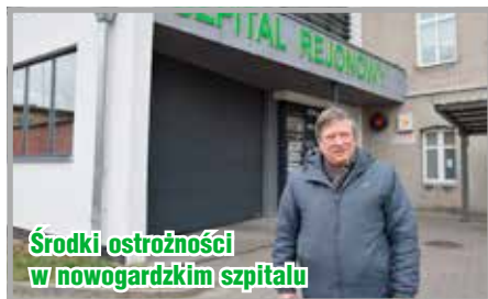
Środki ostrożności w nowogardzkim szpitalu