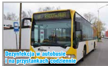
Dezynfekcja w autobusie i na przystankach codziennie