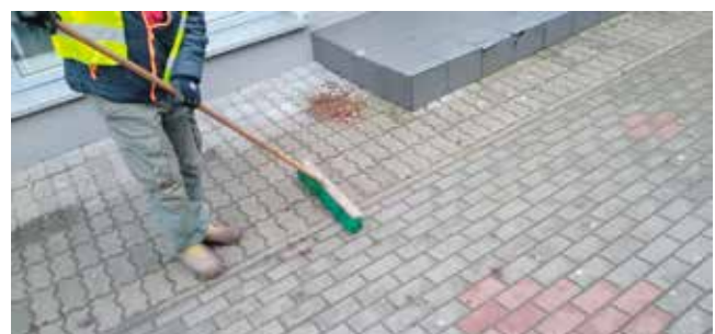
łącznik ulic: 700 lecia i 5 Marca