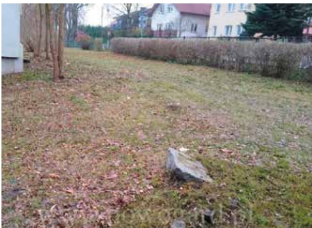
domki przy plaży - grabienie i koszenie terenu

Od ponad dziewięciu lat, na polecenie Burmistrza Roberta Czapli, trwa systematyczne porządkowanie naszej gminy. Prace wykonywane są przez stażystów Urzędu Miejskiego, pracowników interwencyjnych z Urzędu Pracy. W ostatnim czasie wykonano: