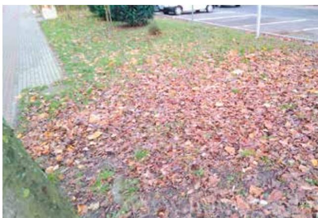
teren gminny ul. Warszawska - porządki