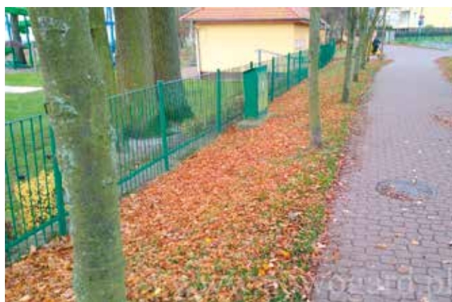
promenada - porządki jesienne