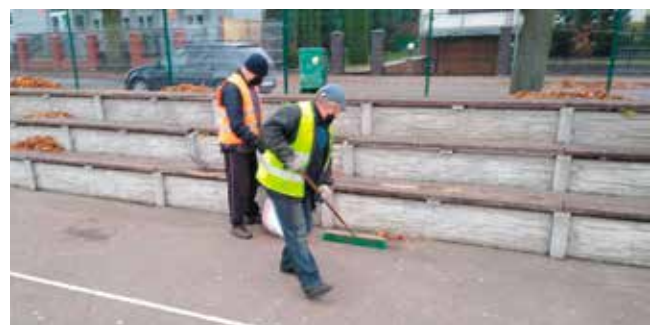
boisko dolne - porządki