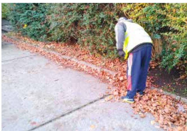
teren gminny - ul. 5 Marca