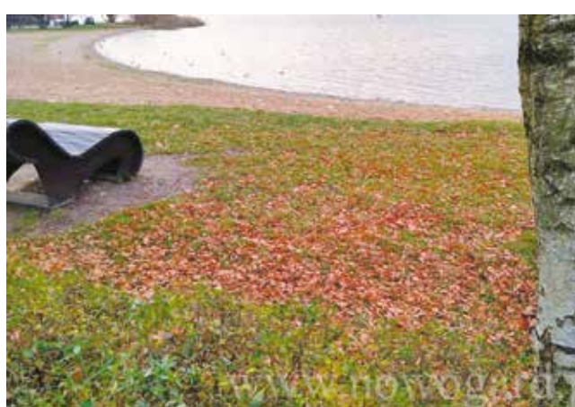
plaża - porządki