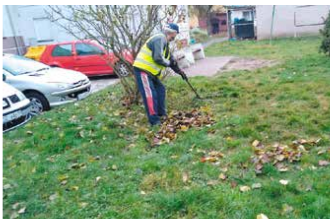
teren gminny - porządki