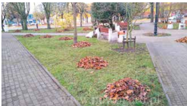
skwer przy ul. 5 Marca - porządki