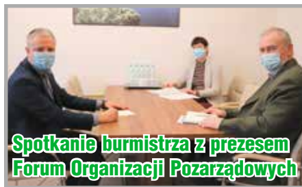
Spotkanie burmistrza z prezesem Forum Organizacji Pozarządowych