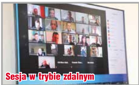
Sesja w trybie zdalnym