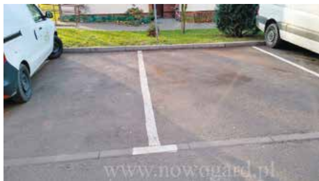
parkingi miejskie - sprzątanie