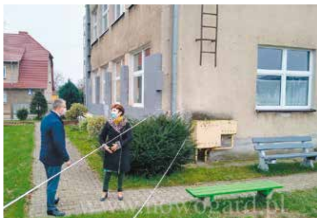
przedszkole nr1 - remont elewacji