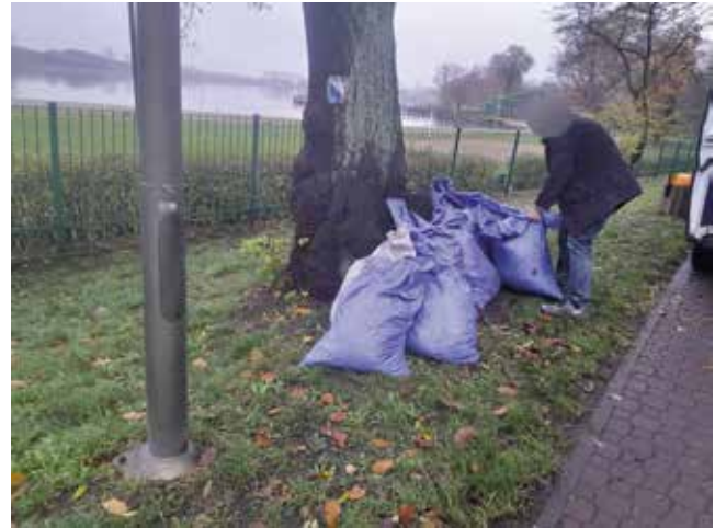
Grabienie liści przy ścieżce pieszo-rowerowej