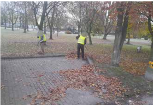
Zamiatanie liści i porządki na boisku dolnym